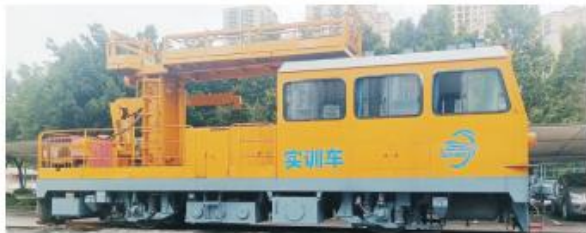
▲ 开进校园的实训车