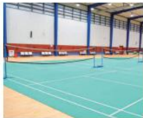
▲ 室内国际标准羽毛球球