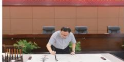
天企业联合会余远牧会长莅临交职校调研座谈

重庆市原副市长余远牧同志莅临交职校指导并题字：“立足高速服务交通，面向社会，打造品牌”。